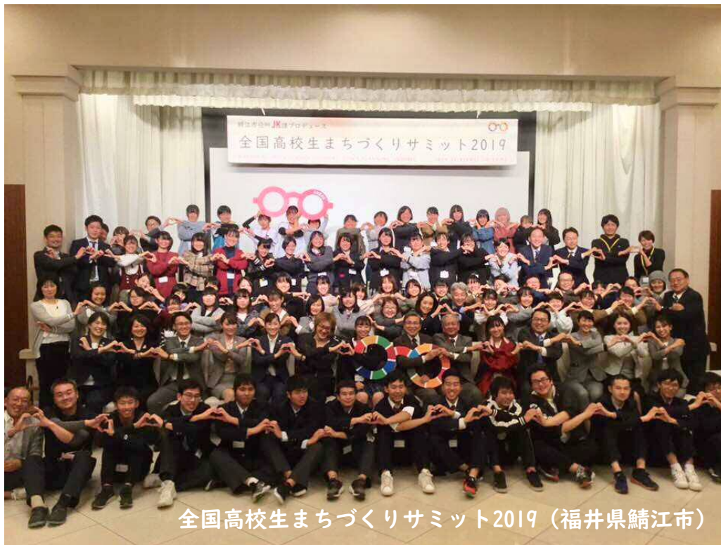
全国高校生まちづくりサミット2019 (福井県鯖江市)