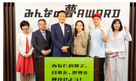
▲ みんなの夢AWARD10 ファイナリスト