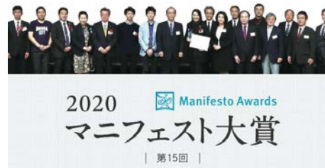
▲ 第15回マニフェスト大賞 市民部門 優秀賞