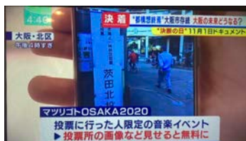
▲ 11/20.A. 毎日放送『ミント!』