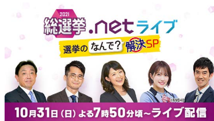
▲ 読売テレビ × UMF Web特番