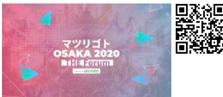
▲ The Forumのアーカイブ動画