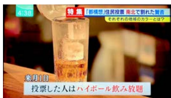
▲ 10/23.O.A. 毎日放送『ミント!』