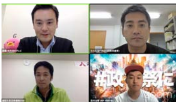
▲ 朝日放送テレビ『ぶっちゃけ都構想』