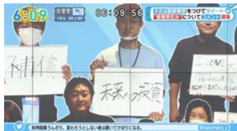
▲ 11/20.A. 朝日放送テレビ『おはよう朝日です』