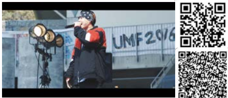
▲ レゲエアーティストCHEHON様との映像作品