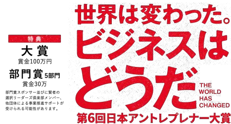
▲ 第6回日本アントレプレナー大賞 エンタメ部門受賞