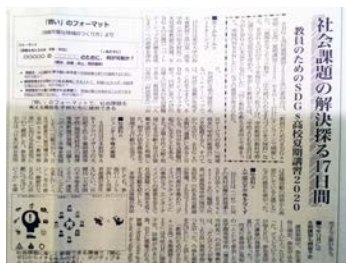
▲ 9/21発行 教育家庭新聞