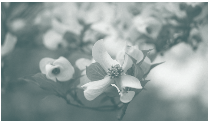
シンボルツリー：花水木