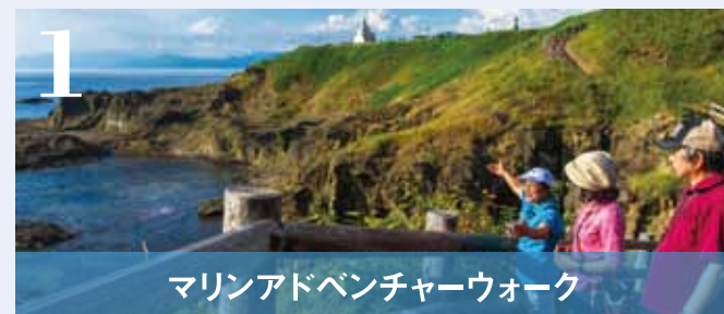
マリンアドベンチャーウォーク

お好きな体験を選んで、かもめ島の海と自然を満喫！宿泊されないお客様の参加も大歓迎です ※マリンピング宿泊には1・2・3、手ぶらキャンプ宿泊には1・2の体験が含まれます