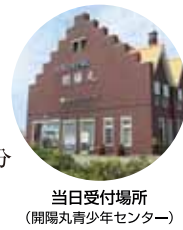
当日受付場所 (開陽丸青少年センター)