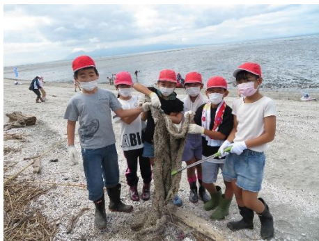
46. 10月1日 海浜清掃・ごみ分類調査 (熊本県荒尾市)