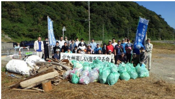
42. 9月12日 海岸清掃活動 (福岡県北九州市)