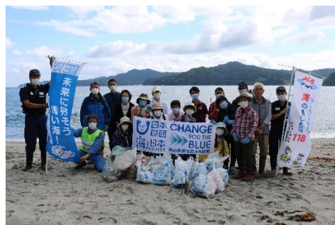
43. 9月25日 釜石市片岸海岸清掃活動 (岩手県釜石市)