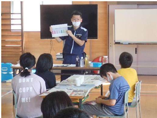
42. 7月8日 土崎小学校海洋環境教室 (秋田県秋田市)