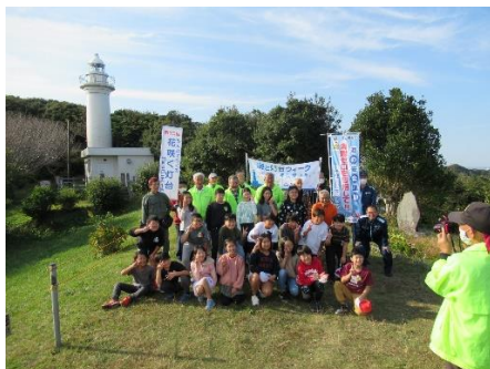
63. 11月4日 みんなで作る花咲く灯台 (千葉県銚子市)