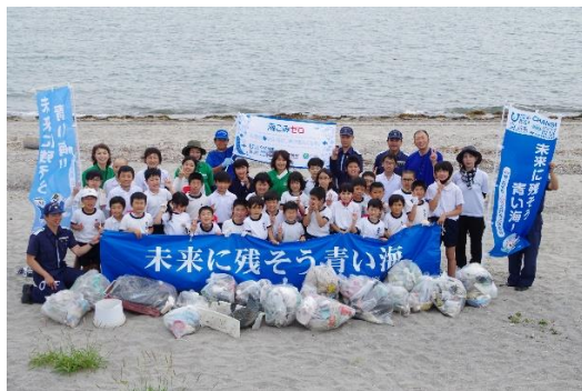
9. 6月2日 前之浜海岸清掃・漂着ごみ調査 (鹿児島県鹿児島市)