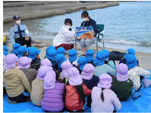
59. 10月20日 こども園すまいる海洋環境教室 (香川県高松市)