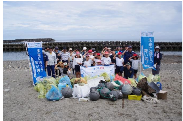
38. 6月12日 円Blue-Sea計画 (鹿児島県龍郷町)