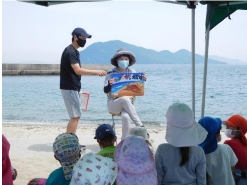
9. 6月8日 カナン保育園海洋環境教室 (香川県高松市)