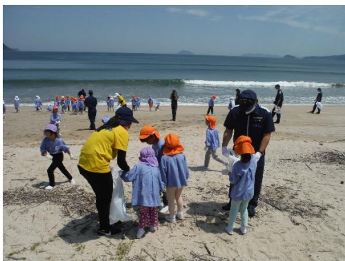
55. 6月21日 海浜清掃及び海洋環境教室 (佐賀県唐津市)