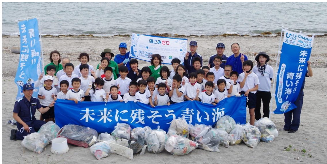
(2021年6月2日 鹿児島市立前之浜小学校との海浜清掃)