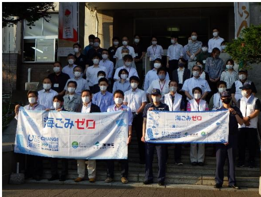
34. 6月10日 聖火リレー開催前クローアップ活動 (岩手県釜石市)