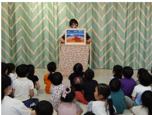
12. 6月11日 かまいしこども園海洋環境教室 (岩手県釜石市)