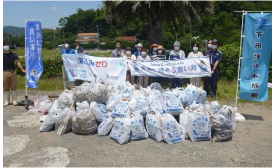
2. 5月30日 吉佐美大浜ビーチクリーン活動 (静岡県下田市)