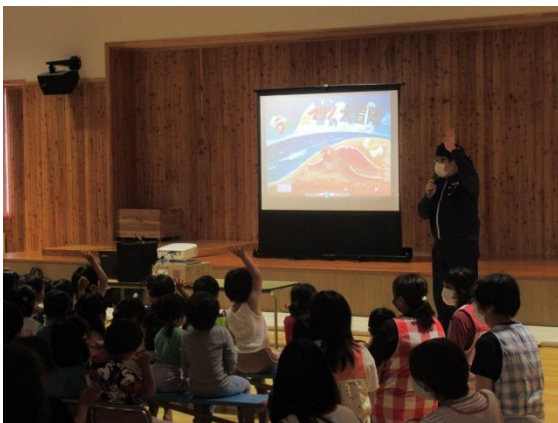
35. 6月29日 広尾保育園海洋環境教室 (北海道広尾町)