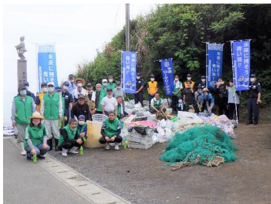
18. 6月5日 茂串海岸清掃活動 (熊本県天草市)