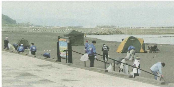
海水浴場クリーン作戦