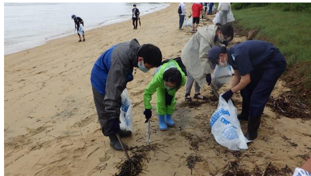
51. 6月19日 長崎ノ鼻海浜清掃 (香川県高松市)