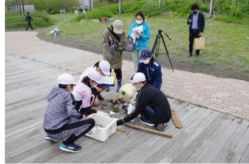
6. 5月31日 海浜清掃・漂着ごみ調査 (青森県鱒ヶ沢町)