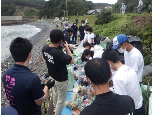
22. 7月9日 東浜海浜清掃 (長崎県対馬市)