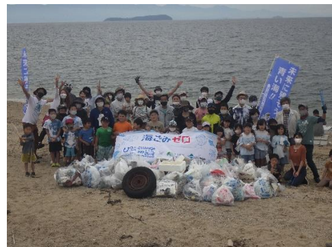
15. 6月5日 大浜海岸清掃 (香川県三豊市)