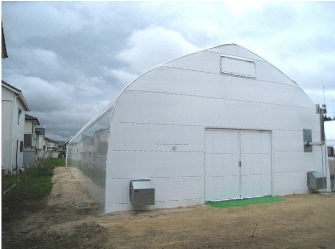
栽培ハウス正面(南側)