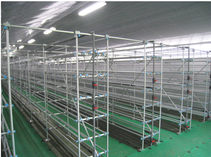
ハウス内部(菌床設置棚)