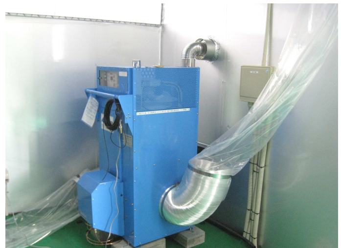
ハウス内部(暖房機)