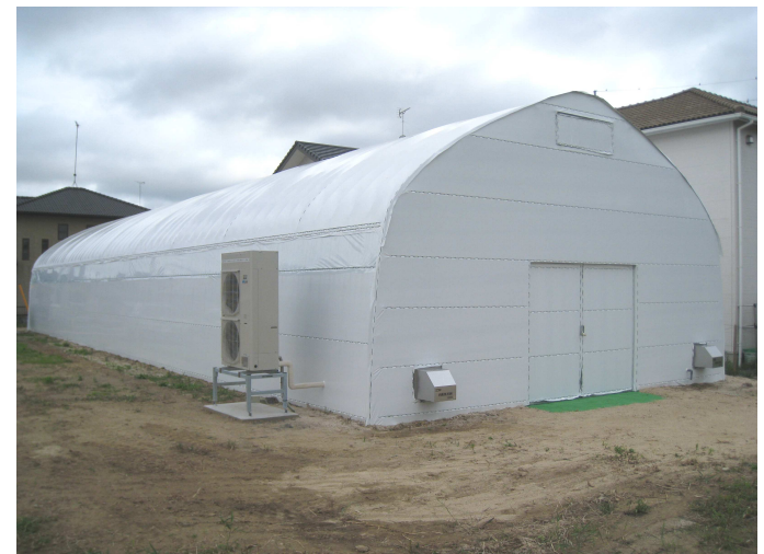
ハウス北側(エアコン室外機)