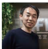
認定 NPO 法人フローレンス 障害児保育事業部 サスマネージャー