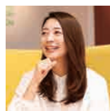
日本財団 公益事業部 国内開発事業チーム