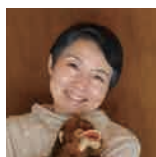
医療法人かがやき 総合在宅医療クリニック 総合プロデューサー