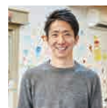
ファシリテーター 一般社団法人Burano 理事