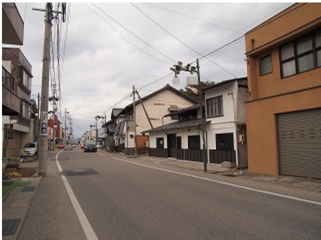
（旧保高宿）商店街全景