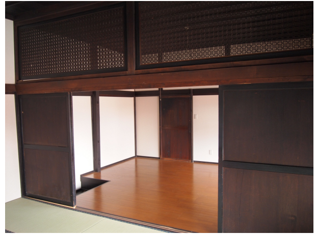
休憩室・多目的室