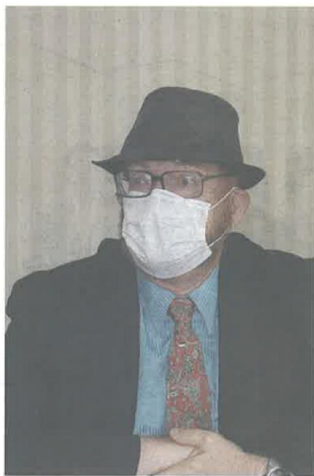
ショーについて説明するマグルダーさん(蒲郡市役所)

蒲郡市営のポートルース蒲郡は、テーマパーク「ラグナシア」を運営するラグーナテンボス(同市海陽町)との共同企画を発表した。23日開幕のラグナシア20周年を記念したショー「セイレーン・サーガ」に協賛するほか、隣接する商業施設フェスティバルマーケットではポートルースのPRコーナーを開設する。