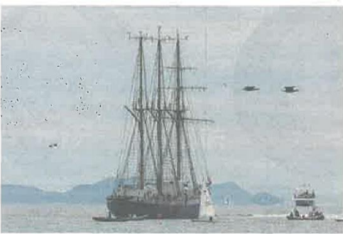
蒲郡市海陽町沖に停泊する帆船「みらいへ」(昨年10月18日撮影)

帆船「みらいへ」の蒲郡入港に合わせて、蒲郡市は24日の体験航海の参加者を募っている。対象は市内在住の小学生以上。無料で参加できる。午前の部(午前9時30分～正午)と午後の部(午後1時30分～4時)に分かれ、定員はそれぞれ40人。集合場所は市内海陽町の豊田自動車機海陽ヨットハーバー。みらいへは全長52