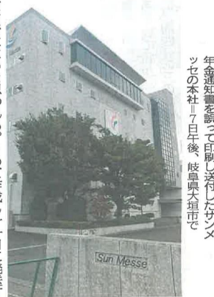
年金通知書を送って印刷し送付したサンメッセの本社。7日午後、岐阜県大垣市で

ク項目では印字のかすれや位置のずれがないかという点に加え、表裏が一致しているか確認することになっていたが、怠ったという。誤った内容のはがきは四日に発送を開始。六日朝、はがきの品質管理担当者、宛名面と通知面異なる管理番号の通知書を見つけ、印刷ミスに気付いた。すぐに発送を止めたが、間に合わずに受給者に届いたのは九十七万件余り上った。同社は、昨年も年金振込通知書の作成などの業務を受託したという。幹部は「担当者は「確認したつもりになってた」と話すが、チェックが甘かったのは今回