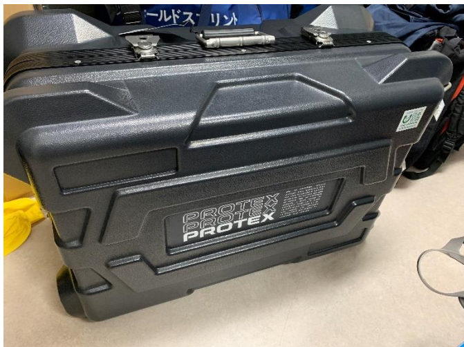
(7) ポータブルサクションユニット 2セット