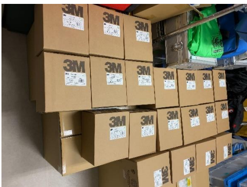
(10) 吸引缶 25個