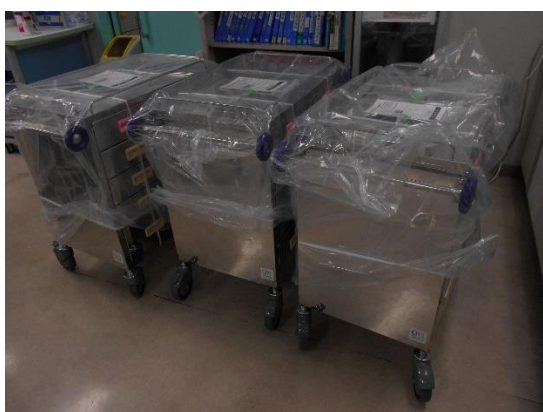
(1 3) エマージェンシーバゲージバッグ 3個