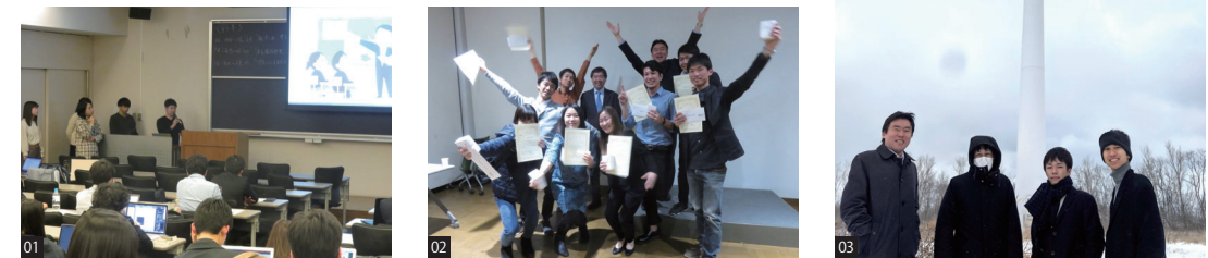
01.Aセメスター総合発表会 02.総合発表会表彰式 03.Aセメスターフィールドワーク

まとめた提言は授業の最終回にグループごとに発表し、優秀なグループを表彰します。成績評価は、各セメスターで提出する課題レポートなどをもとに行います。