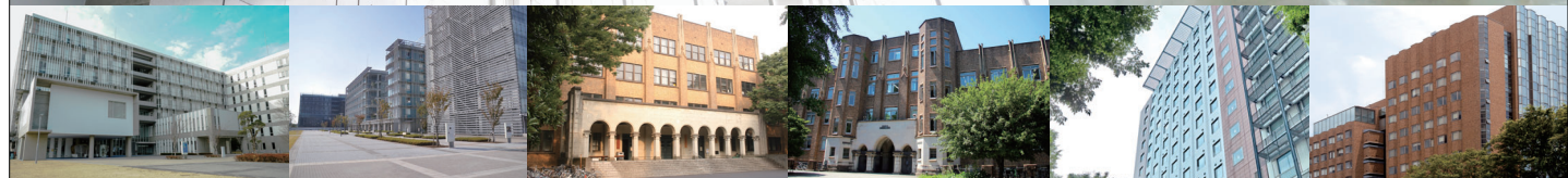
大気海洋研究所 新領域創成科学研究科 農学生命科学研究科 工学系研究科 公共政策大学院 理学系研究科