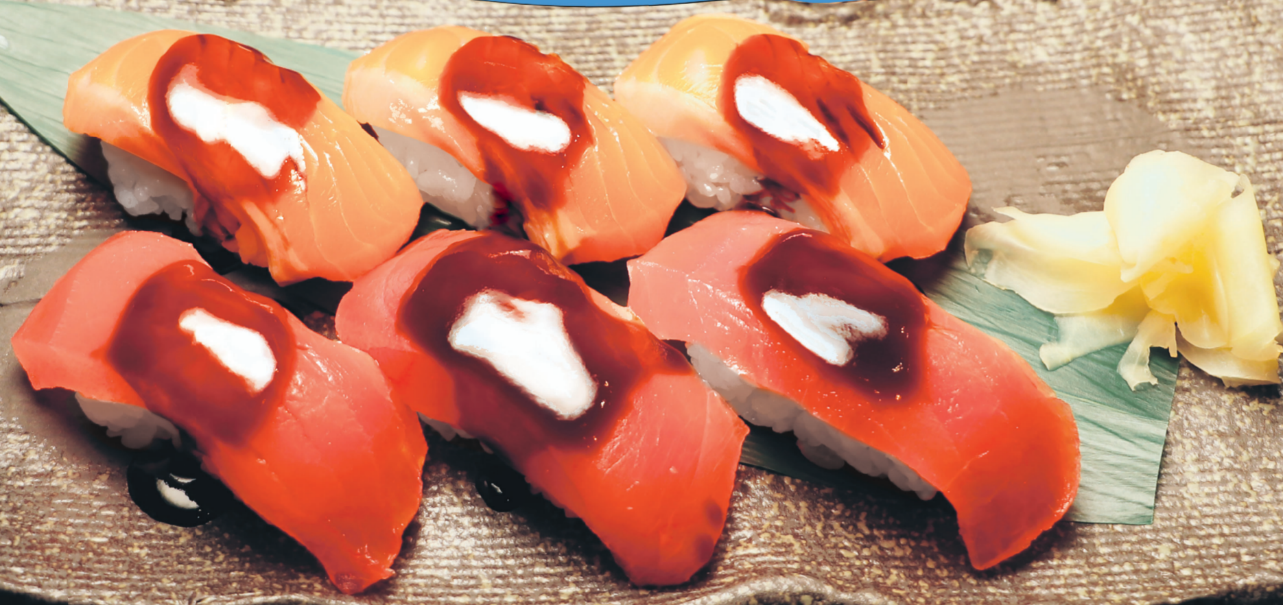
マグロ・富士の介各三点

昨年11月に県内に住む児童14名が過去・現在・未来の視点から山梨と海との関わりについて体験学習を行いました。 今回のオリジナルメニューでは、児童も握った山梨のブランド「富士の介」と山梨県民が大好きな「マグロ」を使った甲州握りのオリジナルセットをご用意しました。 この機会に山梨が誇る海の食文化や流通の変化などを調べ、海についての学びを深めてみてください。 ※詳しくは海と日本プロジェクトinやまなしHPで!