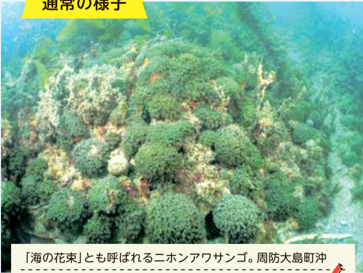
「海の花束」とも呼ばれるニホンアワサンゴ。周防大島町沖には世界最大規模を誇る群生地が広がる。