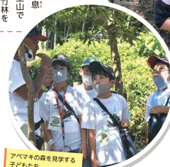
アベマキの森を見学する子どもたち

アベマキの森を見学したりした。隊員たちは「美しい海を守るためには、山もきれいにしなければならぬことが分かった」と口をそろえていました。