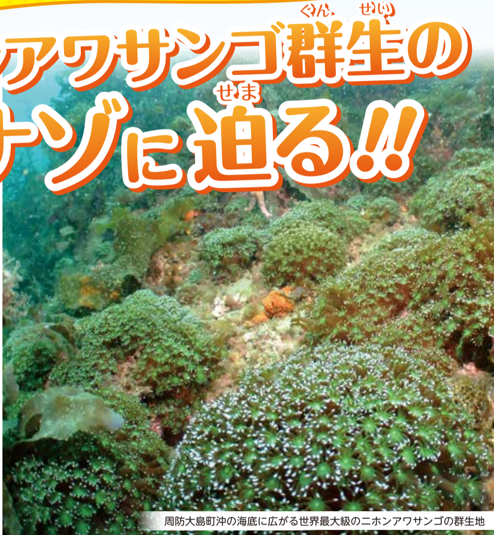
周防大島町沖の海底に広がる世界最大級のニホンアワサンゴの群生地

THE NIPPON FOUNDATION 日本財団 海と日本 PROJECT in やまぐち