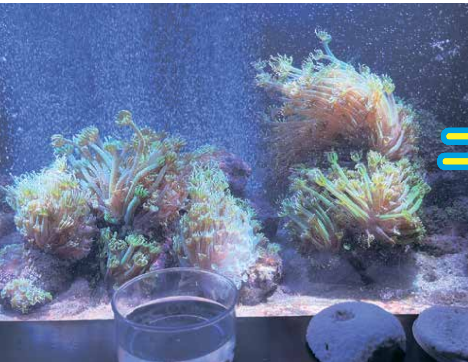
なぎさ水族館に常設展示されているアワサンゴの水槽