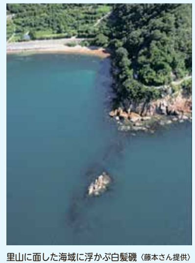
里山に面した海域に浮かぶ白髪磯