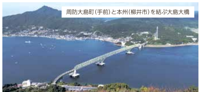
周防大島町(手前)と本州(柳井市)を結ぶ大島大橋

周防大島町は山口県の最東端にあり、瀬戸内海に浮かぶ本島・屋代島と、その周囲の五つの有人島、多くの無人島からなります。本州（柳井市）とは屋代島が大島大橋（長さ1020m）でつながっています。2004年10月に大島、久賀、橘、東和の旧4町が合併し、周防大島町となりました。