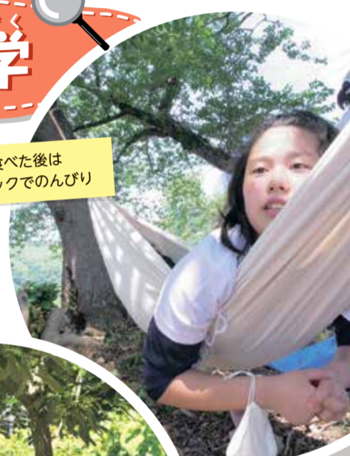
昼食を食べた後はハンモックでのんびり

アベマキの森を見学したりした。隊員たちは「美しい海を守るためには、山もきれいにしなければならぬことが分かった」と口をそろえていました。