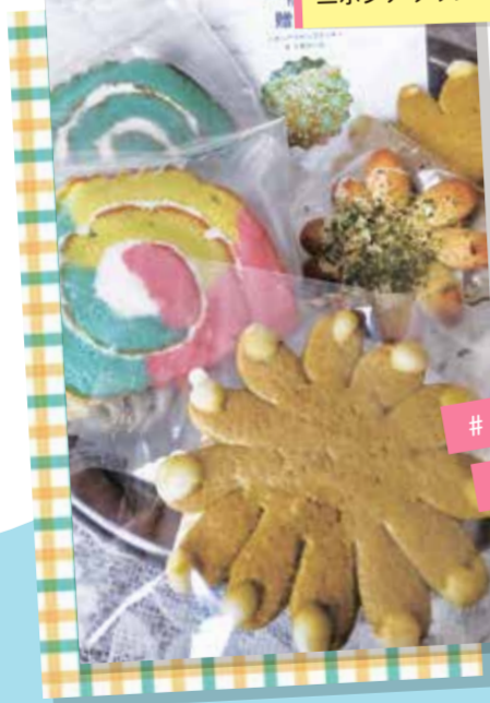
商品化された二ホンアワサングクッキー

スイーツ作りにも取り組まれました。隊員たちが出し合ったアイデアをもとに、地元の菓子店「幸進堂」(周防大島町西安下)が二ホンアワサングをイメージしたクッキー2種類を商品化しました。 クッキーと、同店人気の「うすロール」のセット「海のお花畑」の贈りものが