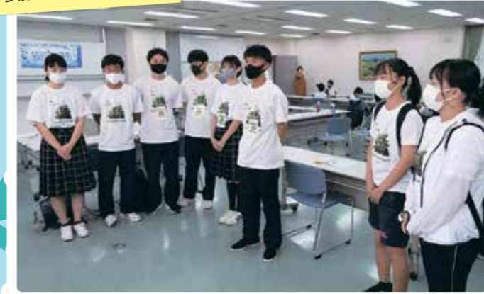
「学びサポーター」として参加した高校生8人