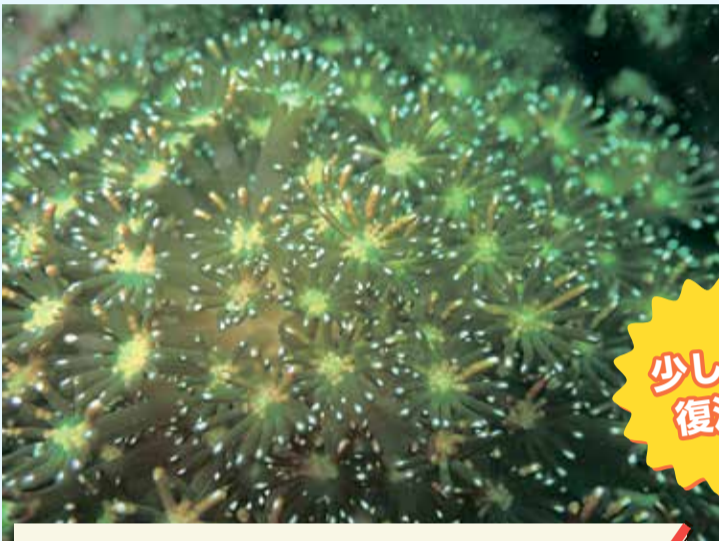
緑色の触手に粒状の幼生を保有したアワサンゴ。