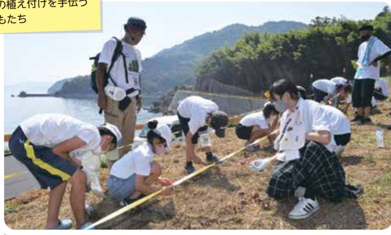
球根の植え付けを手伝う子どもたち

「なぜ周防大島の海にアワサングの群生地が?」「復活していただいな——」。 関係者から話を聞くなどした隊員たちは早速、現地の海へ山へと繰り出しました。 自然に触れ合ったり遊んだりして、「海」と「山」の密接なつながりを実感。 アワサングが順調に育つ様子も確認でき、笑顔がはじけました。