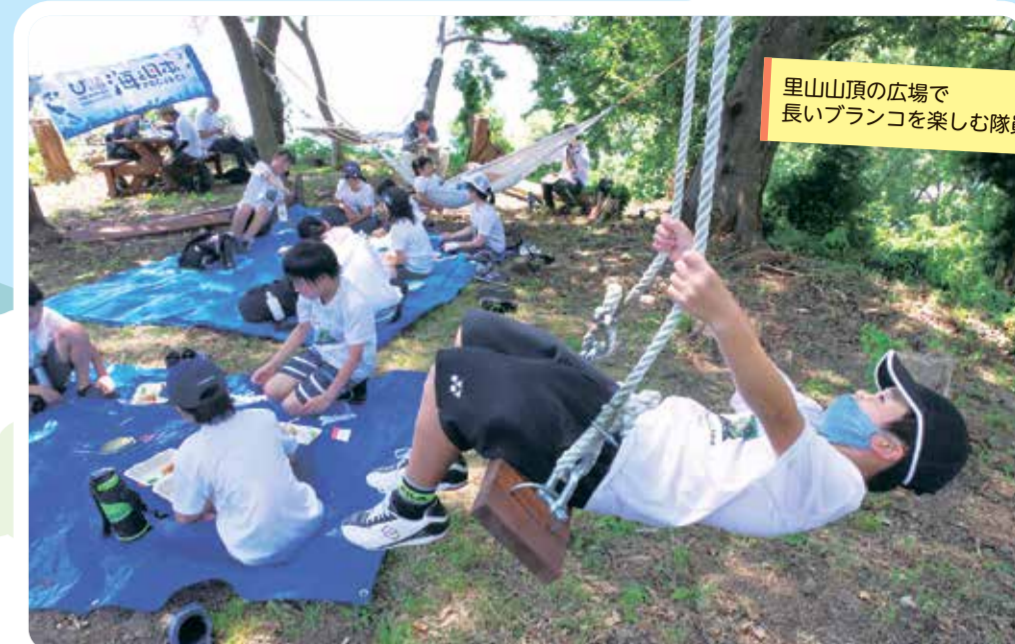
里山山頂の広場で長いブランコを楽しむ隊員