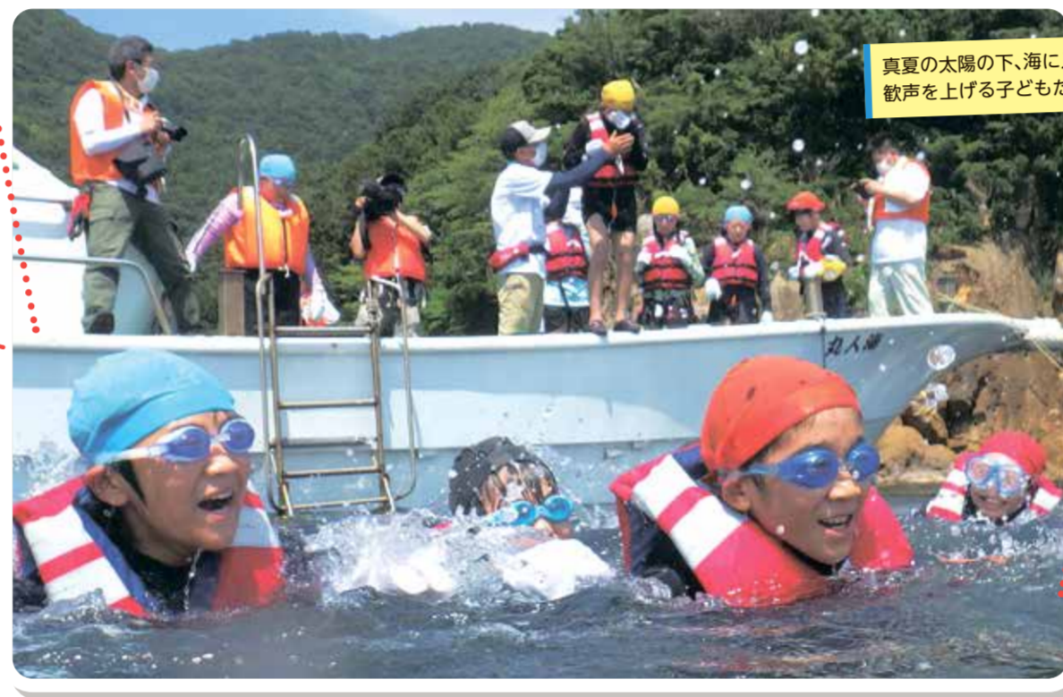
真夏の太陽の下、海に入って歓声を上げる子どもたち