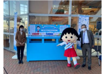
拾い箱贈呈セレモニー（静岡市）