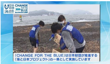
「CHANGE FOR THE BLUE」は日本財団が推進する「海と日本プロジェクト」の一環として実施しています