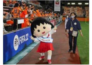
エスパルスホームゲームでのイベント（静岡市）