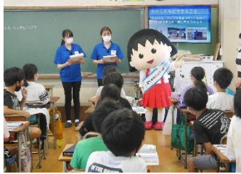
入江小学校出前授業（静岡市）