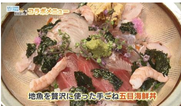
地魚を贅沢に使った手ごね五目海鮮丼