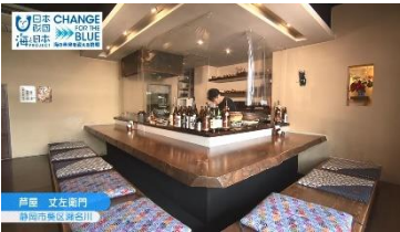
店主 丈左衛門 静岡市東区 芦家川