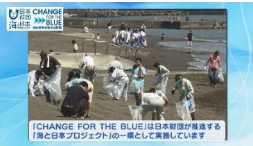
「CHANGE FOR THE BLUE」は日本財団が推進する「海と日本プロジェクト」の一環として実施しています