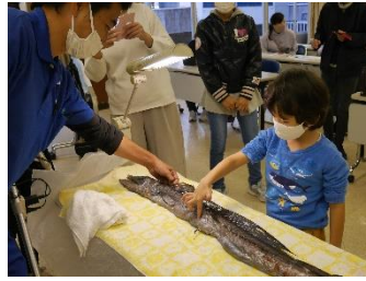
ミスウオの解剖イベント（静岡市）