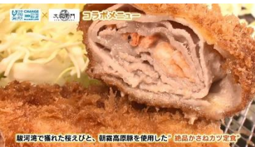
鰻河湾で獲れた桜えびと、朝霧高原産を使用した「絶品かさねカツ定食」