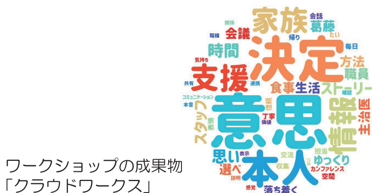
ワークショップの成果物 「クラウドワークス」