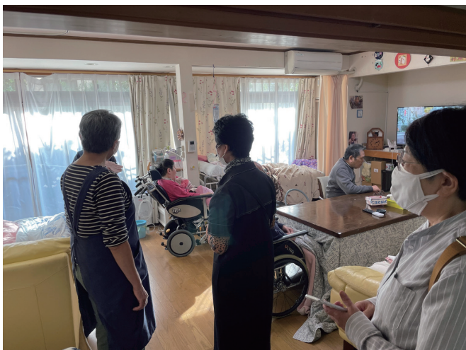
2021年10月30日 「ホームホスピス結びの家くるみ」現地レビュー