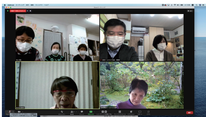
2022年3月3日 「愛逢の家」更新レビュー（オンライン）