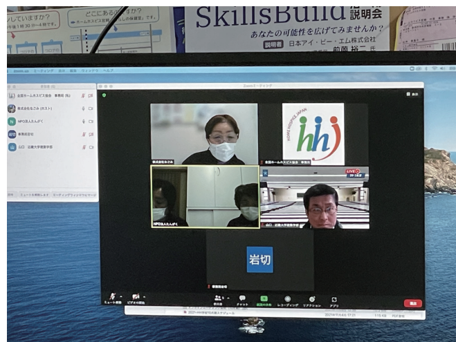
2022年1月25日 「たんがくの家」更新レビュー（オンライン）