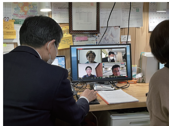
2021年2月16日 「神戸なごみの家」更新レビュー（オンライン）