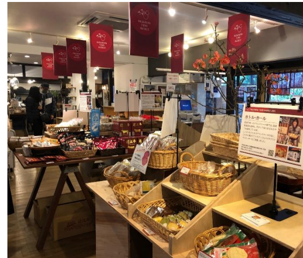
イベント「NAGAHAMA TOWN MARKET」会場