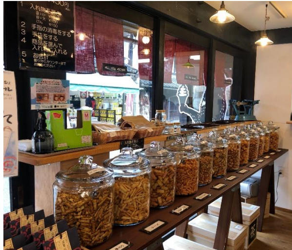
滋賀あられ12種が並ぶ