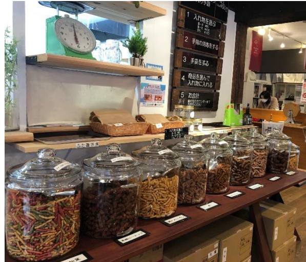
滋賀かりんとう9種が並ぶ