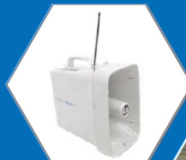
音声ガイダンス (概要)