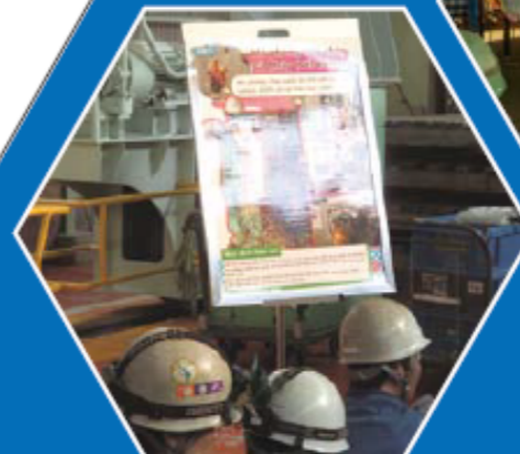
翻訳された表示物