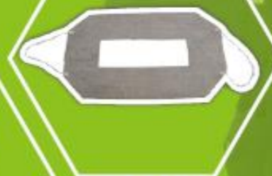
不織布アイマスク