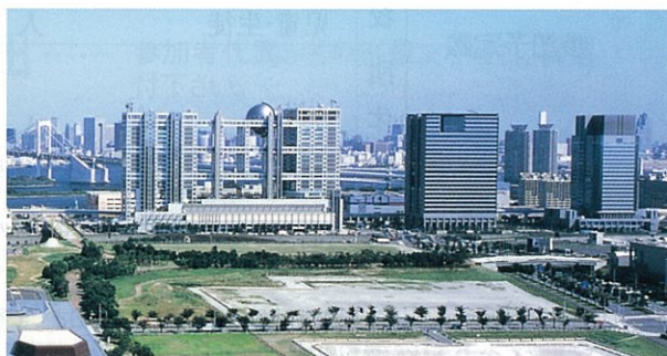
▲東京みなと館からの景色