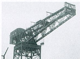
呉海軍工廠に設置された英国製200tクレーン(企画展では、このクレーンの一部分を紹介)