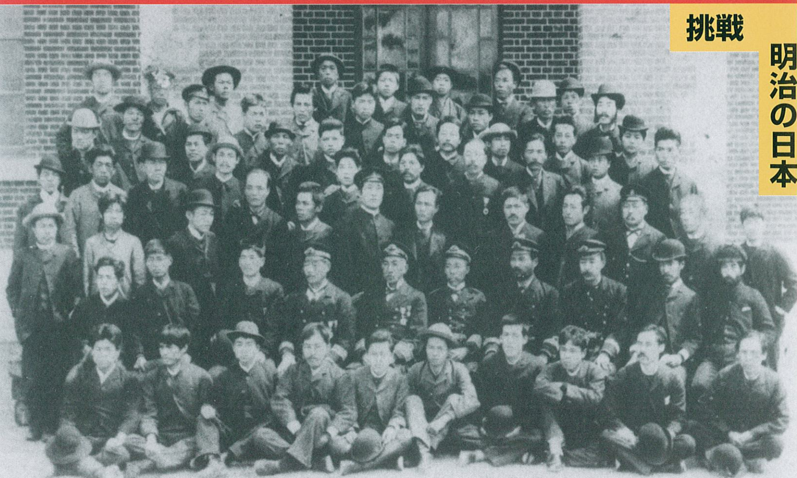
開庁直前の呉鎮守府軍港司令部委員と全職員(明治22年3月18日)