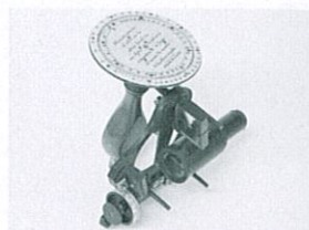
日露戦争期に海軍砲術指揮官(ほうじゅつしきかん)が使用した簡易距離計