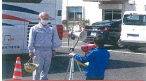
最後に御礼のあいさつ