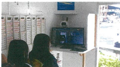
造船所に入る前に検温しましょう！

10月20日、さわやかな秋晴れのもと鹿児島市内の造船所において、公益財団法人九州運輸振興センターと鹿児島運輸支局との共催により、小学5年生102人を対象にコロナ対策を万全にして海事施設見学会を開催しました。