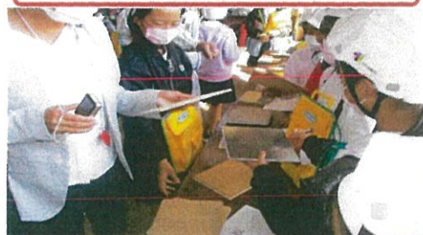
木とアルミと鉄の重さ比べ