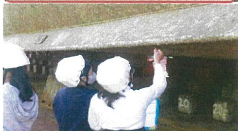
これ何が付いてるの？