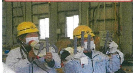
学校名を切っていました