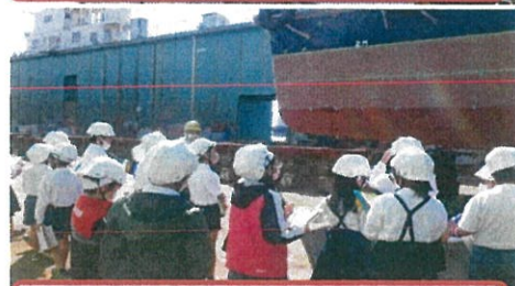
ドック内での説明