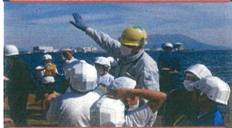
次々と質問がとびます！