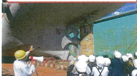
プロペラ大きいなあ～