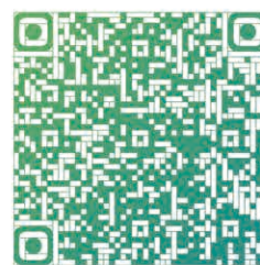
扫码观看《一个人的山谷》