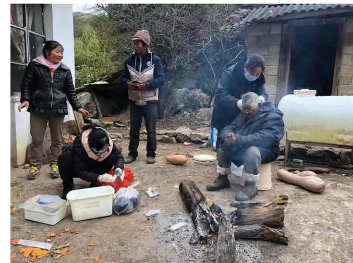
帮助小柱收拾家当