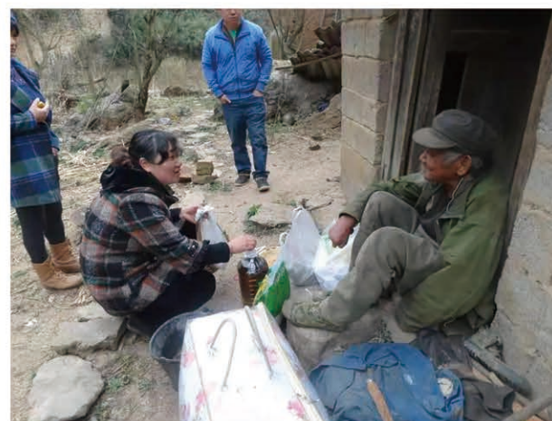
与小主沟通搬迁事宜