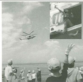
鬼崎北小の児童に機上からエール