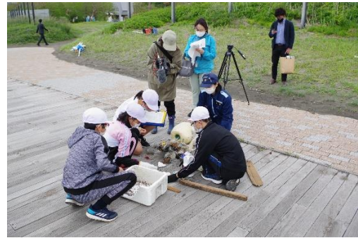
6. 5月31日 海浜清掃・漂着ごみ調査 (青森県鯉ヶ沢町)