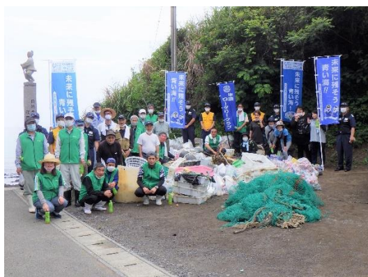
18. 6月5日 茂串海岸清掃活動 (熊本県天草市)