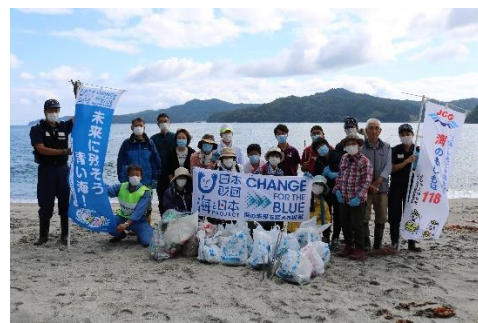
43. 9月25日 釜石市片岸海岸清掃活動 (岩手県釜石市)