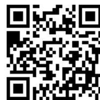
ゼミエントリーフォーム

交流会イベント終了後、参加希望のゼミが具体化したら、右のエントリーフォームに回答。複数エントリーすることも可能です。※イベント未参加でもエントリーができます。