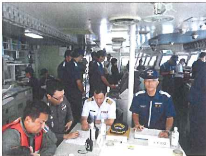
指揮部（しきしま船橋）