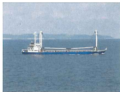
想定被ハイジャック船舶（商船）