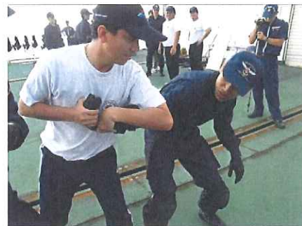
各種制圧実技の実施