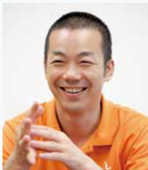
一般財団法人 地域・教育魅力化プラットフォーム 代表理事