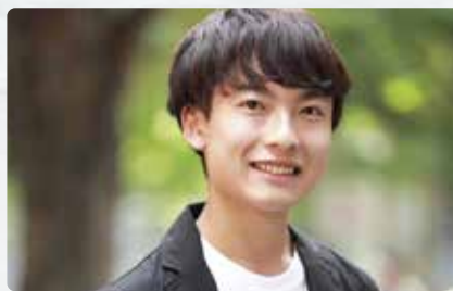
神奈川県→島根県立津和野高等学校→東京大学