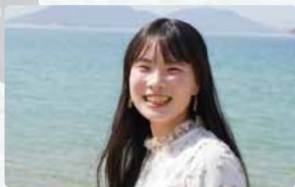
東京都→広島県立大崎海星高等学校→青山学院大学