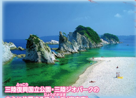
ふつこ 三陸復興国立公園・三陸ジオパークの しょうどがほま 中心に位置する浄土ヶ浜(宮古市)