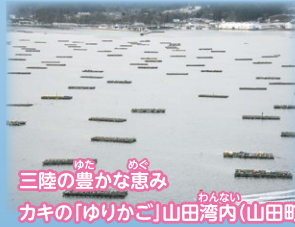
ゆた めく 三陸の豊かな恵み わんない カキの「ゆりかご」山田湾内(山田町)