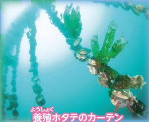
ようしょく 養殖ホタテのカーデン