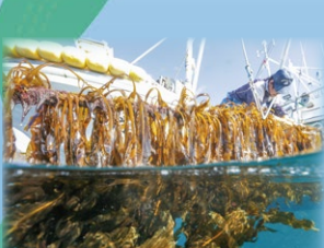
生産量日本一「三陸岩手のわかめ漁」