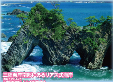
三陸海岸南部にあるリアス式海岸 あなどおしいぞ 「穴通磯」(大船渡市)