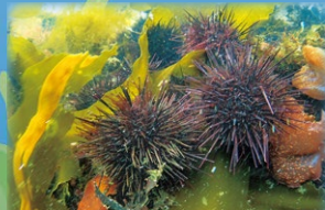
あま 甘くて美味しい三陸のウニ