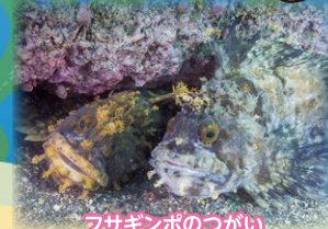
フサギンポのつがい