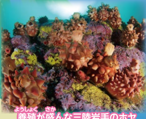
ようしょく さか 養殖が盛んな三陸岩手のホヤ