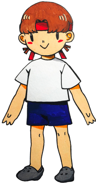
LOVE SEA 愛海 MANAMI/ MICHAN マンミ/ ミチカン