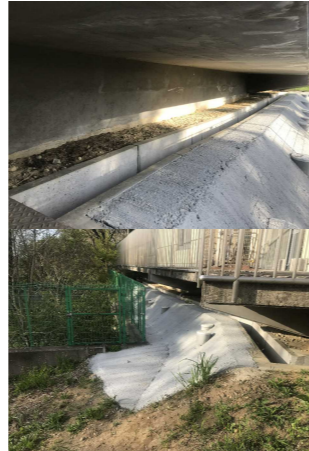
No. 14: (建屋北I7西面) 地盤沈下 法面に防草コンクリート打設 【復旧完了】