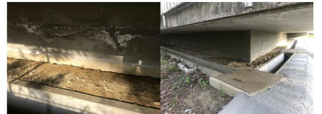
No. 15: (建屋北I7西面) 配管切断、排水管の調査【復旧完了】