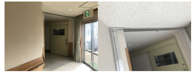
No. 1: (廊下) 床EXP.Jのスレ、天井の落下【復旧完了】