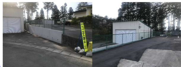
No. 8: (西側アプローチ) 土留擁壁の破損、照明器具撤去、復旧【復旧完了】