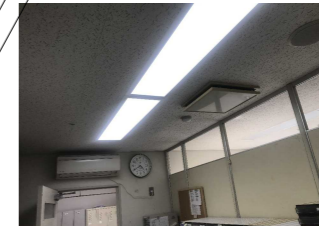
No. 6: (看護婦室) 天井扇の落下1箇所