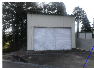
No. 7: (車庫) シャッター破損【復旧完了】