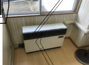
No. 4: (相談室) マンコルの転倒 (◎印、8か所) 【復旧完了】