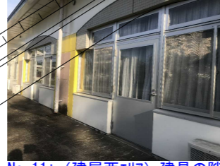
No. 11: (建屋西I7) 建具の隙間、軋み (★印、23か所) (☆印、2箇所) 【復旧完了】