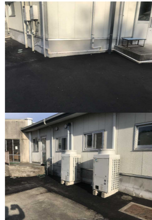
No. 13: (建屋西I7北面) 側溝、As舗装の破損 エアコン室外機のスレ修正 (※印、6か所) 【復旧完了】