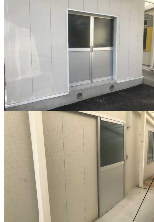
No. 9: (倉庫東面) 7mm引戸破損 (倉庫南面) 引違い戸施錠できない 【復旧完了】