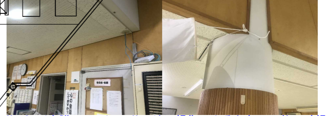
No. 3: (介護ステーション) 天井下地の損傷によるたわみ、柱の破損 【復旧完了】