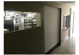
No. 2: (配膳室) 戸袋内ボード外れ 【復旧完了】