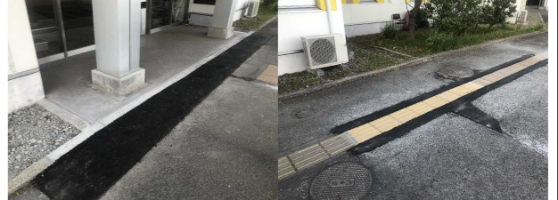
No. 5: (正面入口) As舗装のひび割れ、点字ブロックの沈下 【復旧完了】