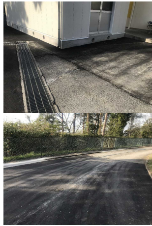
No. 12: (建屋西I7) 側溝、As舗装の破損 【復旧完了】