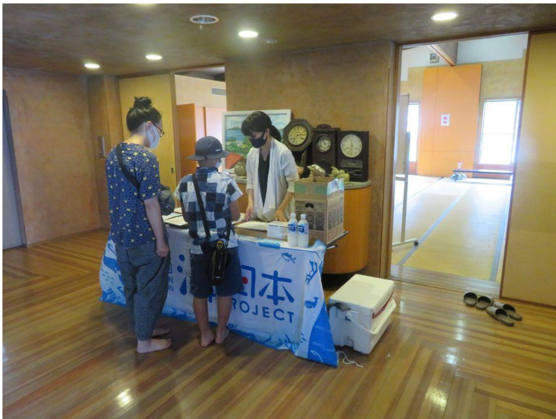
【7月18日 SDGs カードゲーム体験会振り返り～里海ランチ編～】