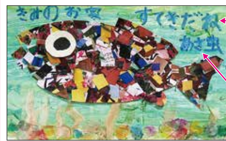
ポスターやハガキの例