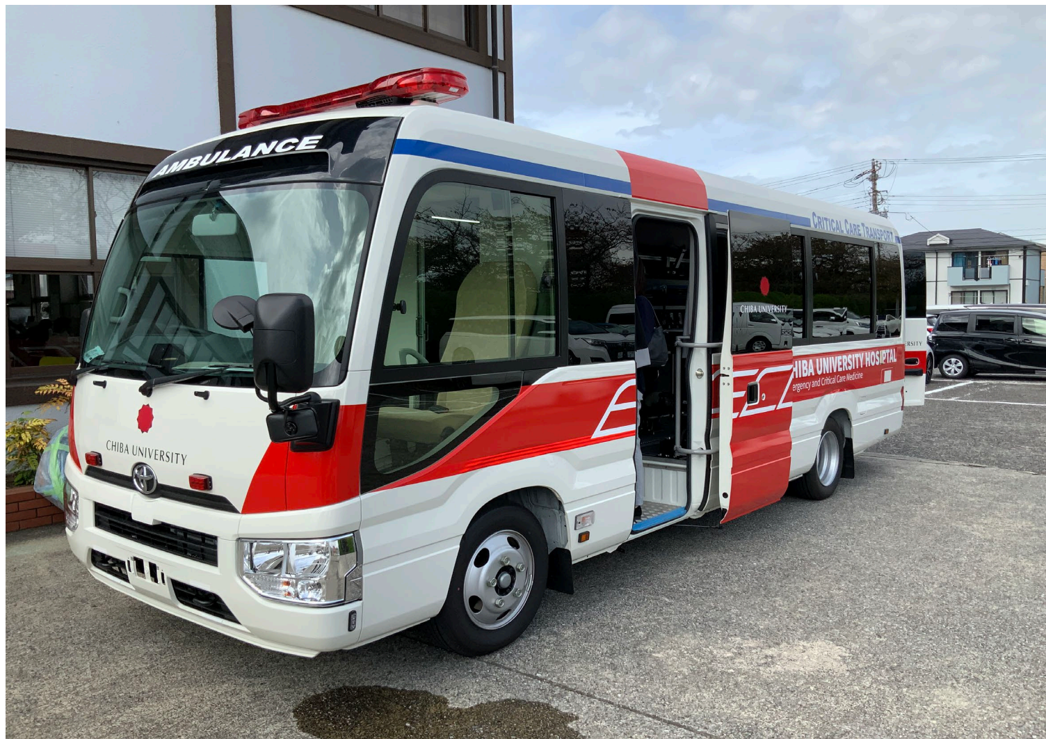
(1) ECMO カー