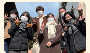
ボランティアスタッフの皆さん

ときには「どうしよう?」と悩んで、ときには「今日やっと通分・約分を理解してもらえました!」と嬉しそうに笑って。小学生だけでなく、私たちスタッフも成長できる居場所です。これから先も、お互いに寄り添い合いながらも成長し続けられる教室にしていければと思っています。