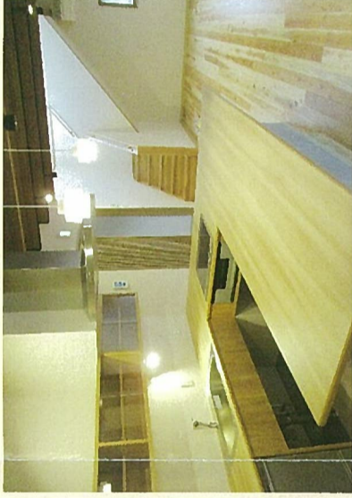
リビング・キッチン

常に介護を必要とする方に対して、主に昼間において、入浴・排せつ・食事等の介護、調理・洗濯・掃除等の家事、生活等に関する相談・助言その他の必要な日常生活上の支援、創作的活動・生産活動の機会の提供のほか、身体機能や生活能力の向上のために必要な援助を行います。