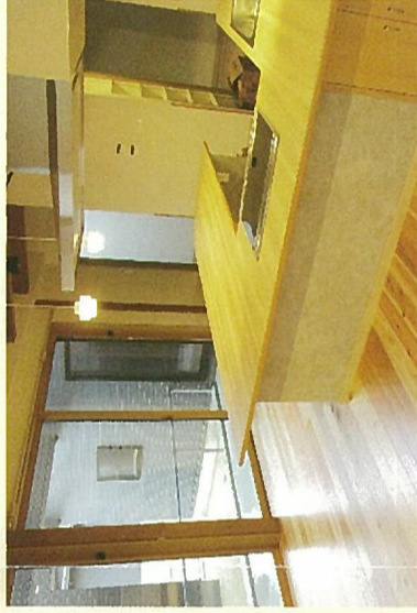
リビング・キッチン