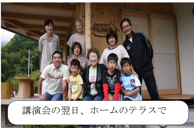
講演会の翌日、ホームのテラスで