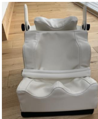
座位保持 シュクレ