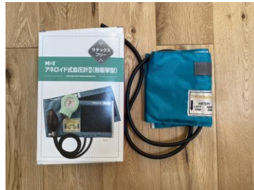
アネロイド血圧計