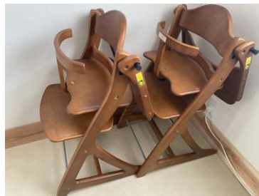
研修会議用テーブル・チェア