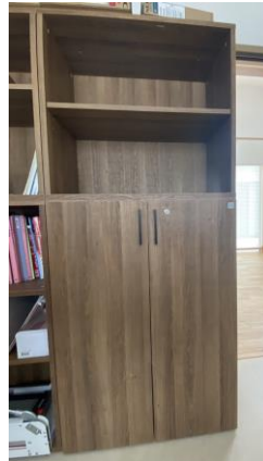
鍵付き書庫・本棚