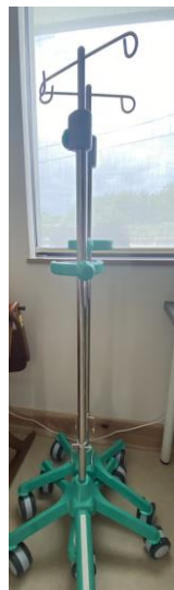
イルリガートル スタンド