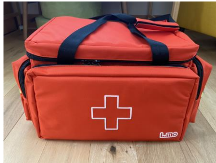
救急バック・小児用マスク 小児用聴診器