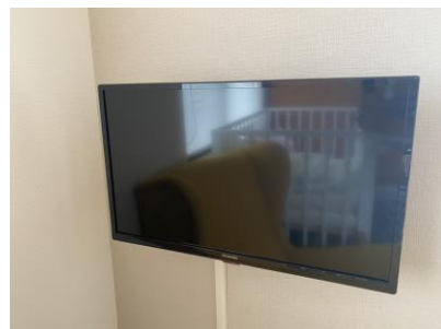
テレビ・壁掛け金具