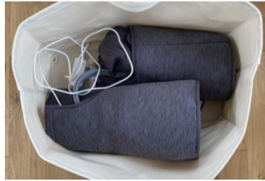
フットマッサージ器