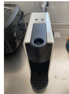
コーヒーメーカー