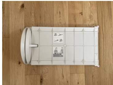
小児用セイン朝敬