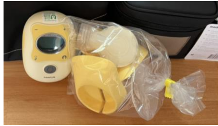
フリースタイル搾乳機