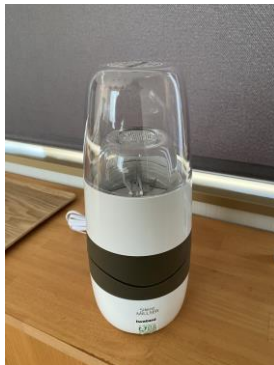
フードプロセッサー