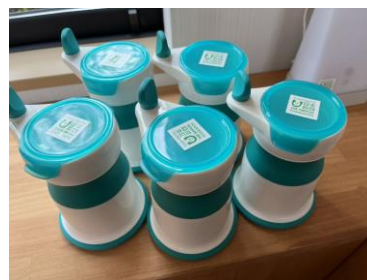
オクソーベビーフードミル