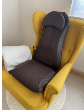
マッサージシート