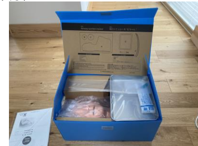
吸引シミュレーター