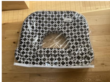
双子用じゅうクッション