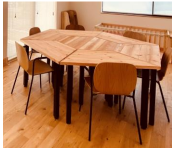
研修会議用テーブル・チェア