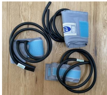
小児用マンシュート