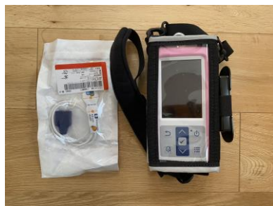
ポータブルSPO2モニタ・ オキシセンサー