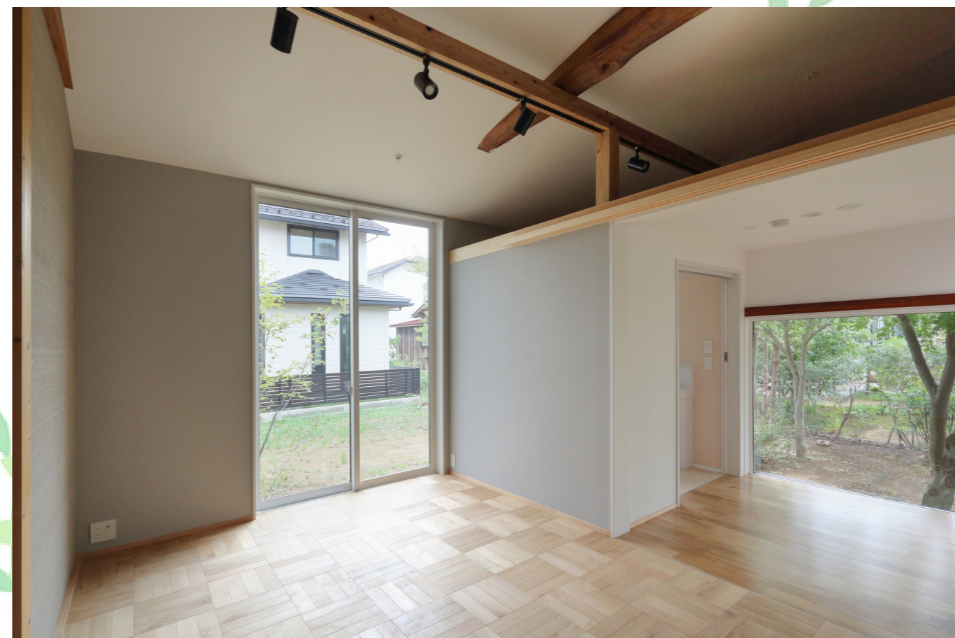
【居室4】 約6.5帖：傾斜天井、フローリングの洋間です。すぐ近くにトイレがあります。静かな裏庭に面しています。