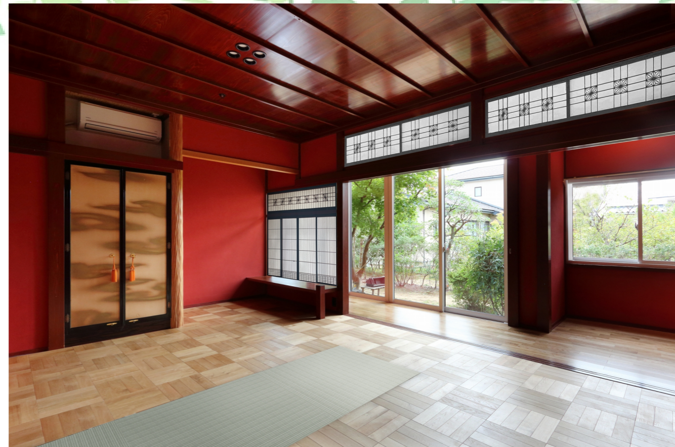
【居室2】 約11.5帖：通称「赤の間」で、加賀文化ならではの和風の意匠を活かしたお部屋です。縁側越しに庭に面しています。