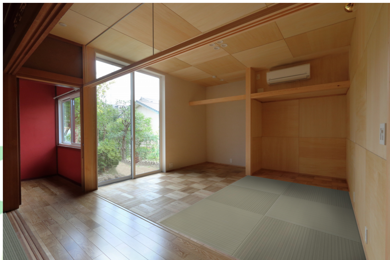
【居室3】 約8帖：広い庭に面しており、デッキが付く予定です。