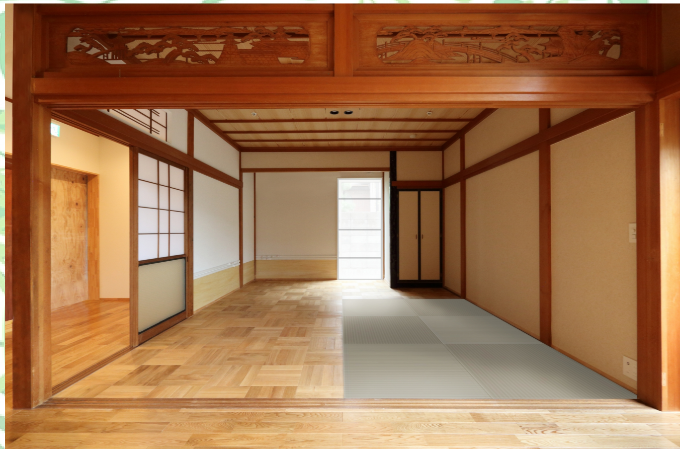
【居室1】 約10帖：中庭に面しており、トイレのすぐ近くです。