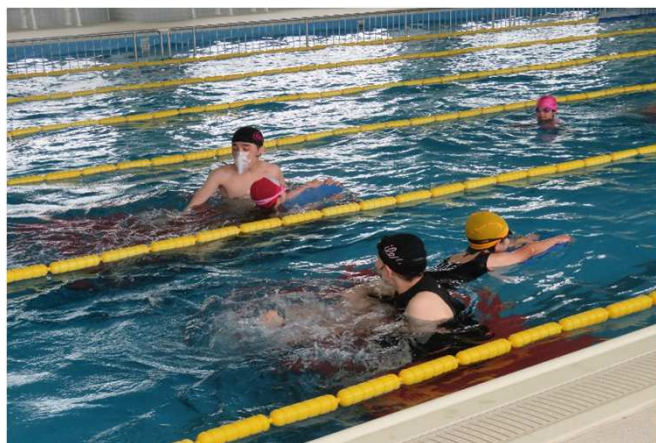
先生から熱心な指導を受ける