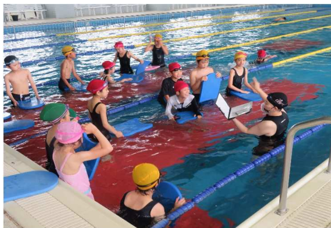
入水後に先生のお話を真剣に聞く子どもたち