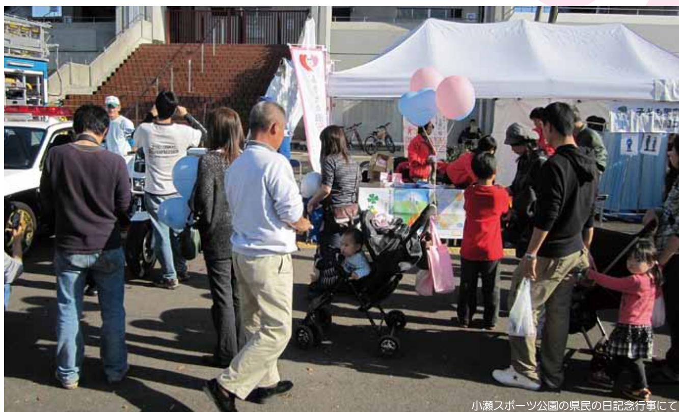
小瀬スポーツ公園の県民の日記念行事にて

また、11月19日、20日に甲府市・小瀬スポーツ公園で開かれた「県民の日記念行事」では、陸上競技場前の「ふれあいけいさつコーナー」で、当センターのボランティア支援員ら約20人がそろいの赤いウインドブレーカーに身を包み、来場者にチラシなどを手渡し、PRしました。