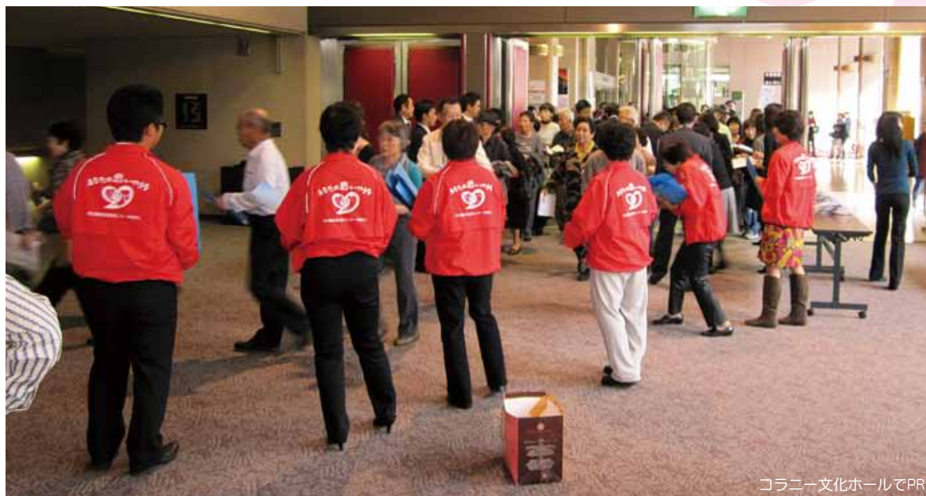
コラニー文化ホールでPR

当センターでは、山梨県警の協力を得て、被害者支援活動の広報・啓発活動を行っています。10月23日、甲府市・コラニー文化ホールで開かれた山梨県警察本部主催の「山梨県警察音楽隊第5回ふれあいコンサート」では、エントランスにて資料を配付、観客に被害者支援活動の重要性を訴えました。