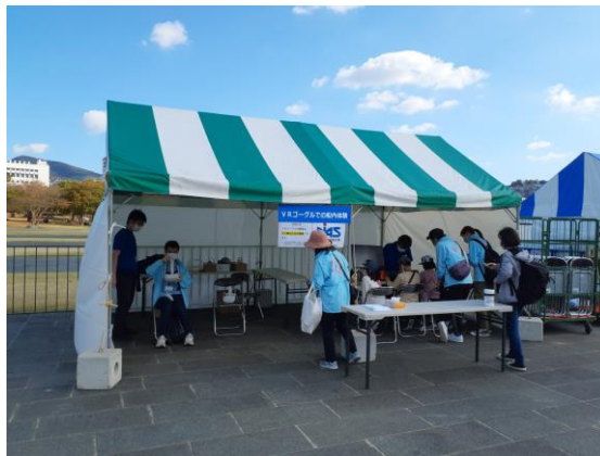
【VRゴーグルによる船内体験】