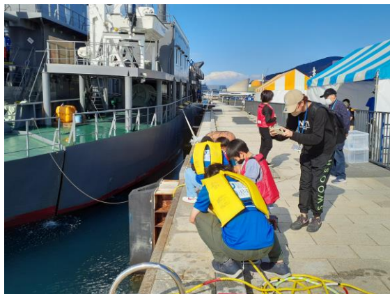
【水中ドローン体験教室】