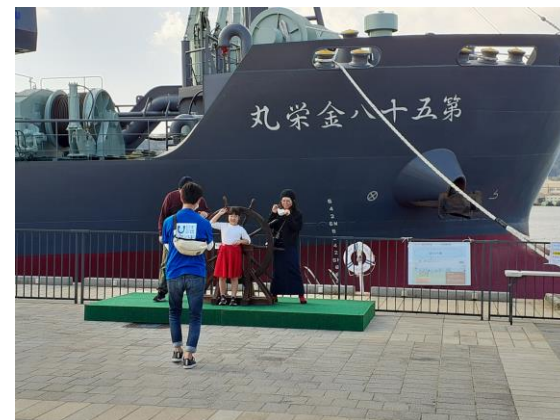
【記念撮影コーナー】