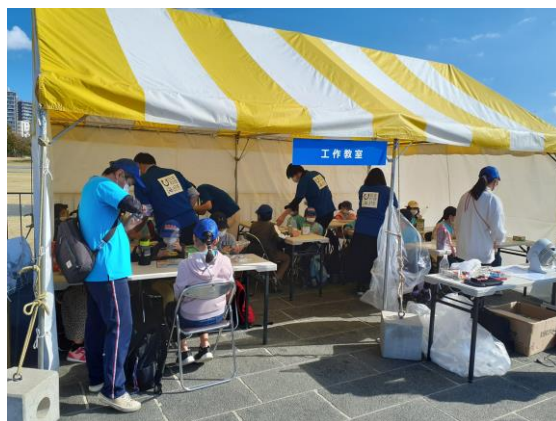
【風力発電工作教室】