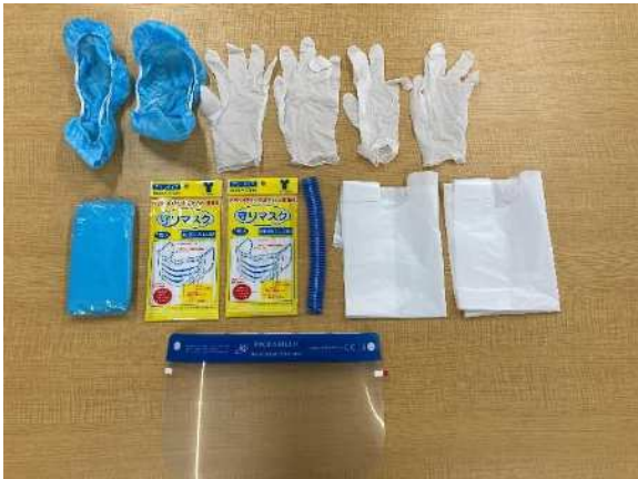
(個包装内容平置き)