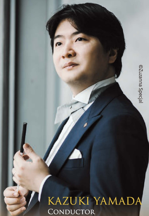
KAZUKI YAMADA CONDUCTOR