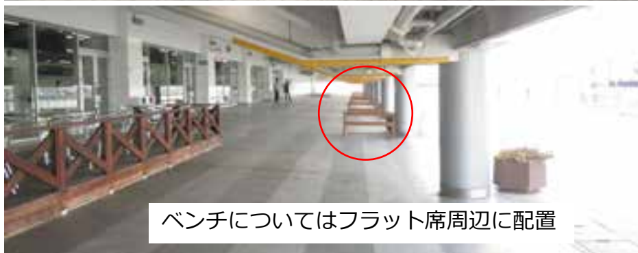
ベンチについてはフラット席周辺に配置