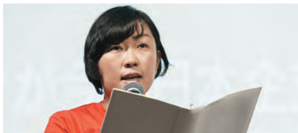
聞き手 | 森真理子 / Moderator: Mariko Mori

Also known as Kanoken. Born in Akiita prefecture, he is Deaf from birth. He began dancing in his early childhood after seeing it on television, then learned the street dance in a dance club at Tsukuba University of Technology. In 2016 he went on to NY’s Broadway Dance Center (BDC) to study various styles of dance. With TCF, he has performed in <True Colours Festival2018> (Singapore), <Summer School> (2018), an educational program to nurture performers with disabilities, <True Colors MUSICAL> (2020), and <True Colors CIRCUS> (2021). For the opening ceremony of the Tokyo 2020 Paralympic Games, he made an appearance in an airplane costume and his vibrant sign language had lured much attention.