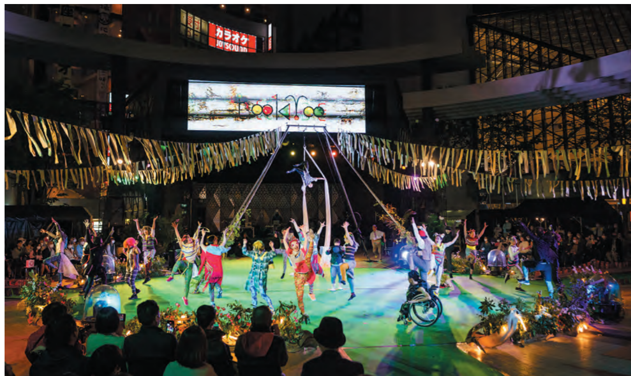
True Colors CIRCUS エンディングのステージ風景

*座談会はオンラインにて実施 text | 飛田恵美子(言祝ぐ) 手話通訳 | 岡田直樹、武井誠