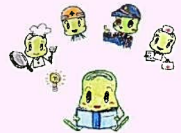
⑧ 職業適性セミナー