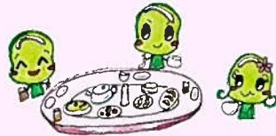
② (中華) テーブルマナー