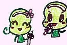
⑬ 振り返りと各自発表

後 援 公益財団法人 毎日新聞大阪社会事業団 社会福祉法人 大阪府社会福祉協議会 大阪市児童福祉施設連盟養護部会