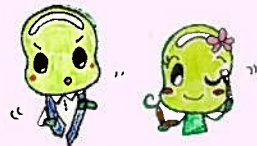
③ 身だしなみセミナー