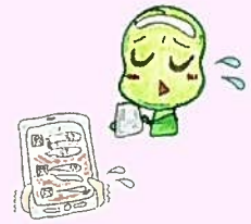
④ スマートフォンの 安全な使い方