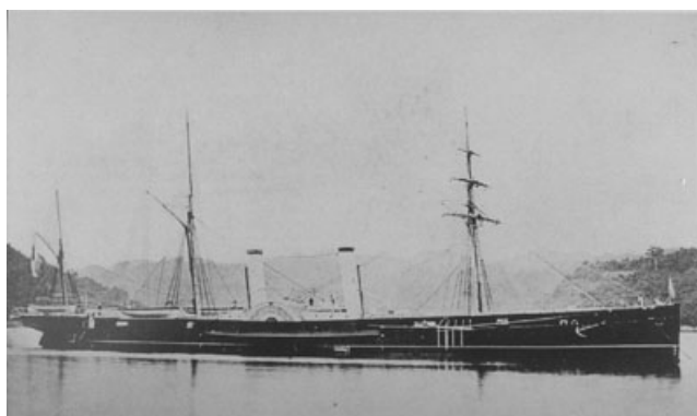
軍艦「春日」

1879 (明治 12) 年 2 月 8 日、「賽瑞丸」という貨物船が品川沖で、暴風に遭遇して、転覆した。これを認めた軍艦「筑波」は端舟に少尉補以下 16 名を乗せて派出し、「賽瑞丸」の乗組員 2 名を救助し、介抱して蘇生させた xxiii 。