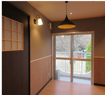
リビング (くつろぎコーナー)