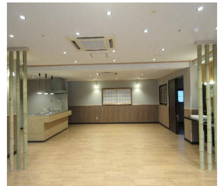
キッチン ダイニングスペース