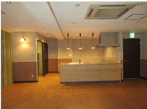
キッチンスペース (左: 物品庫)