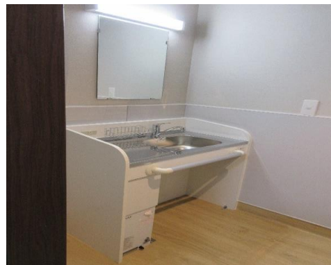
居室内洗面台(温水器付)