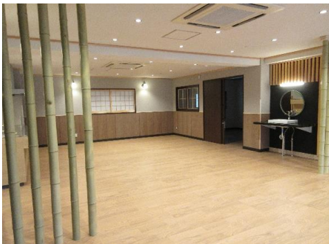
手洗いとスタッフルーム (ダイニング角度から)