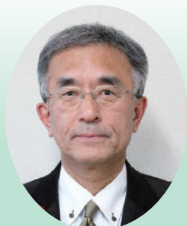
北海道 下川町 町長 谷 一之 様

農業、林業・林産業が基幹産業。夏はプラス30度以上、冬はマイナス30度以下になる年もあるなど寒暖差が大きく、積雪も多い。スキージャンプが盛んで、これまで7名のオリンピック選手を輩出している。