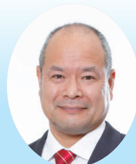
島根県 雲南市 市長 石飛 厚志 様

自然豊かで美濃桃山陶の窯跡や戦国時代の山城跡など歴史、文化の資源が身近にあり、それを守る市民活動も盛んな魅力あふれるまち。世界的な技術を誇る多くの企業や商業施設は市の経済を支え働く場を提供している。