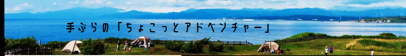
手ぶらの「ちょこっとアドベンチャー」