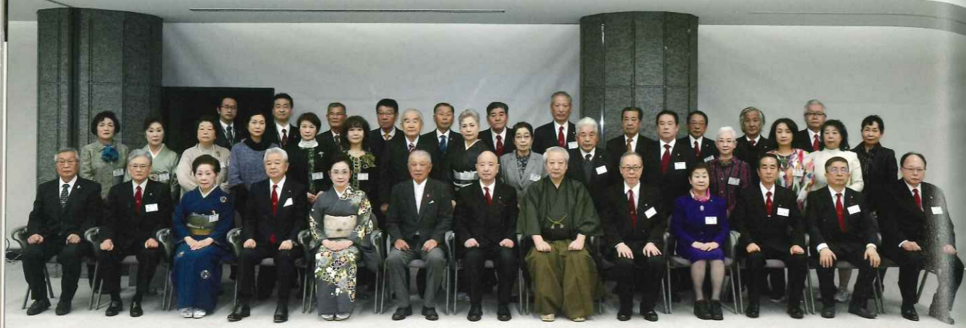
上:会議に先立って行われた記念撮影。日本財団 笹川陽平会長、日本吟剣詩舞振興会役員とともに、各地区連協から推薦された宗家・会長31人が一堂に会した 下:意見交換会は基本的に挙手により行われたが、できるだけ多くの人に意見を述べてもらうために後半は事務局から名指しで実施された